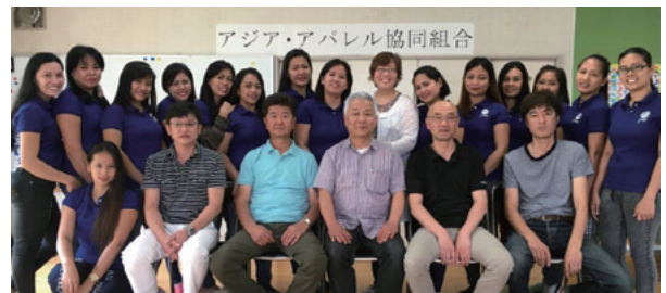
[実習生と組合員の皆さん]

現地との繋がりを強化することで、優秀な技能実習生を確保し、国際貢献に取り組んでいる当組合の活動に、今後も大きな期待が集まります。